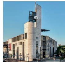
Entrée principale / Billetterie